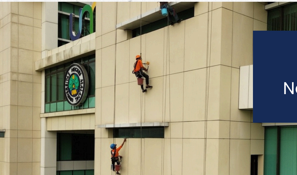
Universitas Negeri Malang