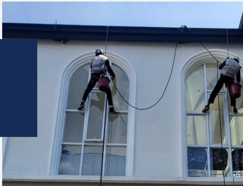
Golden Hill Batu